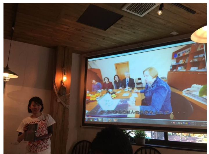
「モルドバ日本文化文明協会」幹部メンバーによるビデオ・メッセージ （同協会から贈られたチョコレートを参加者に配布）