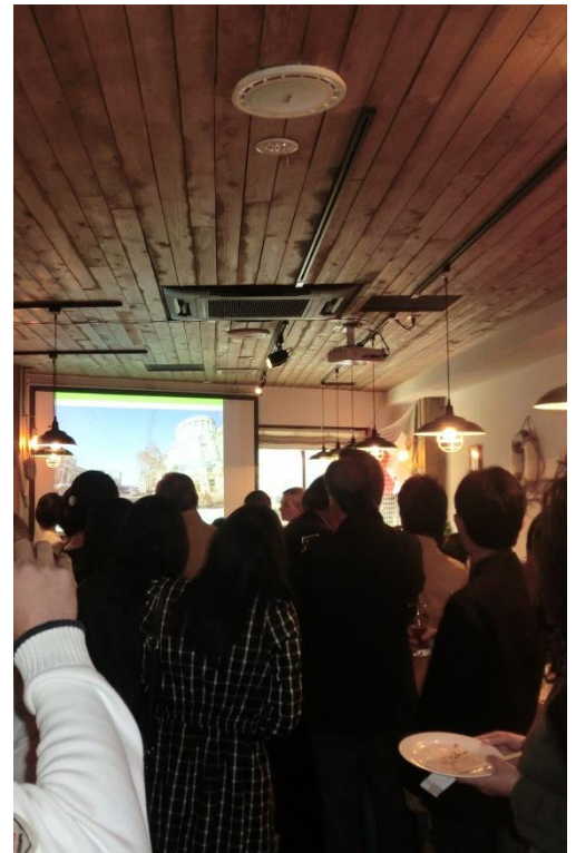
報告を熱心に聴いてくださった参加者の皆様