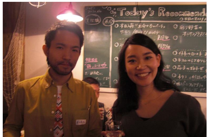
モルドバジャパン幹部