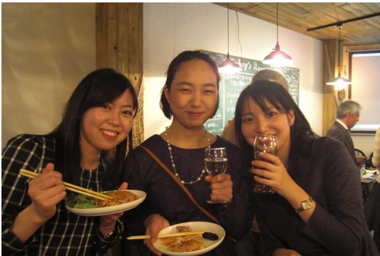
学習院女子大学の研修でモルドバを訪問した参加者